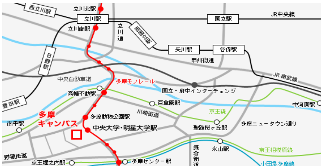
キャンパスマップ Tama-Campus